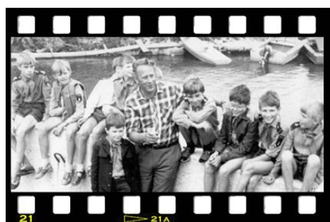
С ребятами из «Каравеллы»