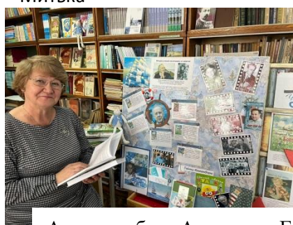
Автор лэпбука Атаманова Г.Г.